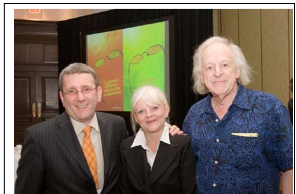
Marcel Sabourin, auteur, comédien, scénariste et mentor était conférencier du midi à l'occasion du 7 e Rendez-vous annuel du Réseau de mentorat d'affaires.